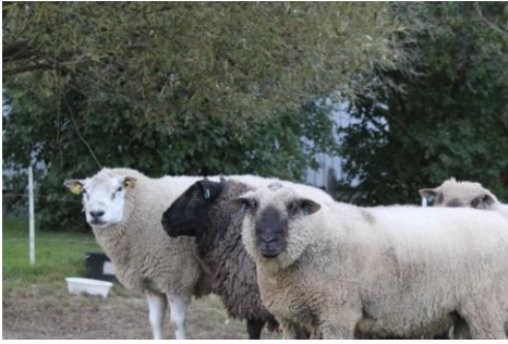
Pässienkin pitää päästä pihalle.