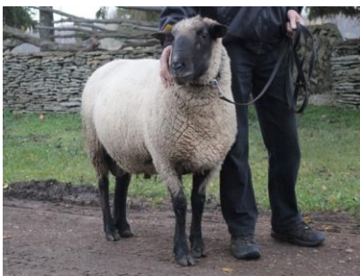
Mies ja pässi.

Eläinten terveyden ja hyvinvoinnin varmistaminen lampoloissa tehdään valituissa laatupisteissä parhaita käytäntöjä noudattaen. Uuhenvuosi etenee suunnitellusti ja ennakoiden vaiheesta toiseen.