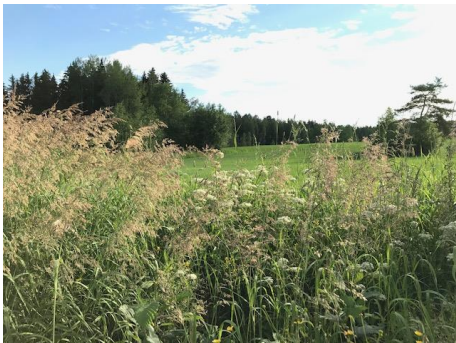
Kesä on kohta kukkeimmillaan ja laitumet ja laiduntaminen pitävät lampurin kiireisenä.

Eläinten terveyden ja hyvinvoinnin varmistaminen lampoloissa tehdään valituissa laatupisteissä parhaita käytäntöjä noudattaen. Uuhenvuosi etenee suunnitellusti ja ennakoiden vaiheesta toiseen.