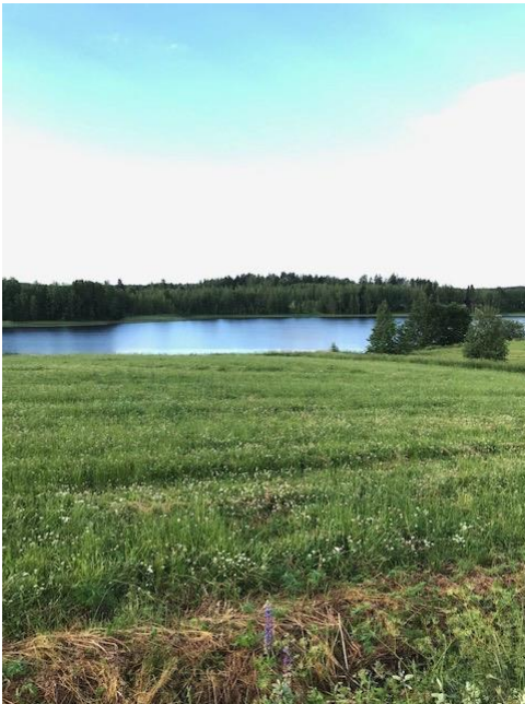
Nyt laitumet kasvavat.