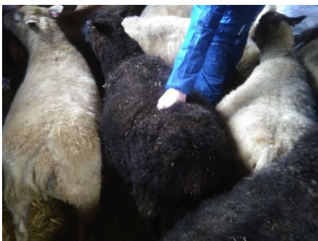
Kuntoluokitus sujuu karsinassakin, kunhan uuhet ovat ”kasassa”.

Eläinten terveyden ja hyvinvoinnin varmistaminen lampoloissa tehdään valituissa laatupisteissä parhaita käytäntöjä noudattaen. Uuhenvuosi etenee suunnitellusti ja ennakoiden vaiheesta toiseen.