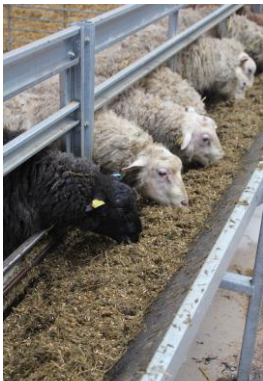
Kaikki mahtuvat syömään.

Eläinten terveyden ja hyvinvoinnin varmistaminen lampoloissa tehdään valituissa laatupisteissä parhaita käytäntöjä noudattaen. Uuhenvuosi etenee suunnitellusti ja ennakoiden vaiheesta toiseen.